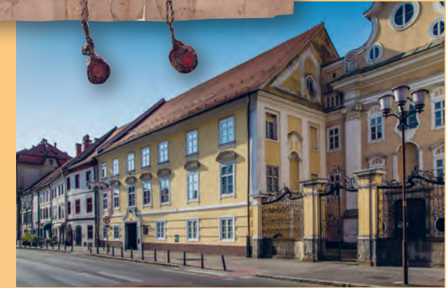
Pokrajinski arhiv Maribor Maribori Területi Levéltár Privilegijska listina za trg Turnišče, 2. september 1548. Turnišče mezőváros kiváltságlevele, 1548. szeptember 2.