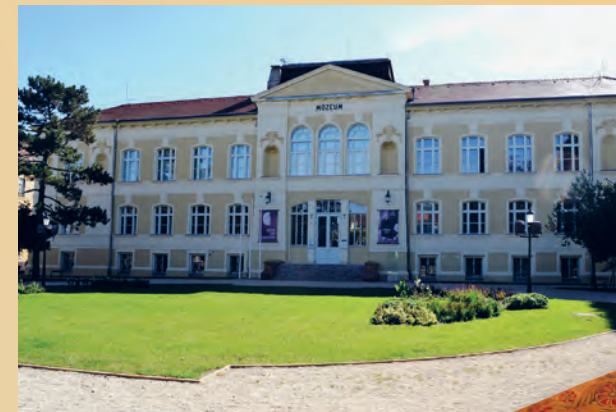
Savaria Megyei Hatókörű Városi Múzeum Mestni muzej Savaria Škatlica za britev, Csempezkopács, 1851. Borotvadoboz, Csempezkopács, 1851.