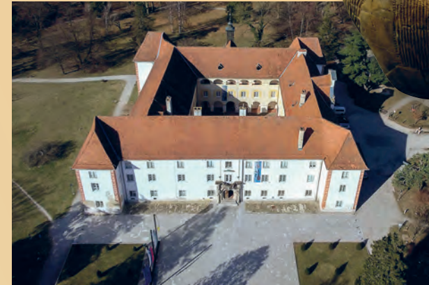
Pomurski muzej Murska Sobota Murazombati Muravidéki Múzeum Okrašena bakrenodobna žara z najdišča Pod Kotom – jug. Dísztett rézkori hamvveder Pod Kotom – dél lelőhelyről.

A projekt célja a kulturális örökségre vonatkozó, szakmailag hiteles, nyilvánosan hozzáférhető adatok mennyiségének növelése és felhasználásuk szélesebb körűvé tétele. Az e-documenta Pannonica projekt termékeit a határon átnyúló területek sokszínű kulturális öröksége és történelme iránt érdeklődőknek szánjuk, valamint felismerhetőbbé tételük és mindkét ország turisztikai kínálatában való megjelenésük elérésére.